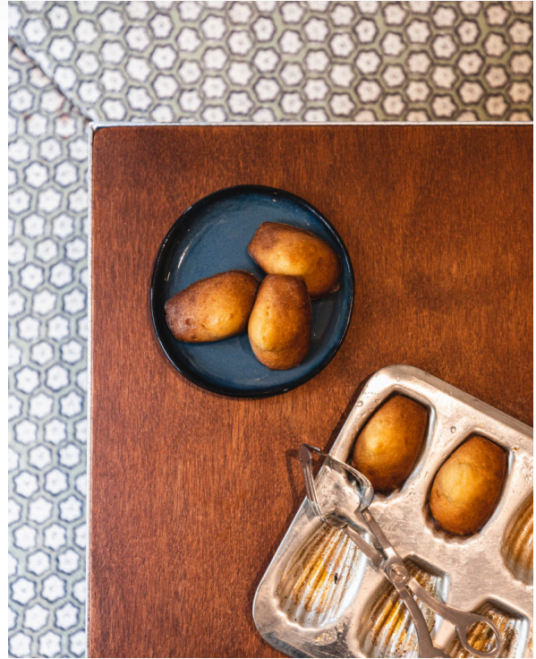
@ Carole Cheung