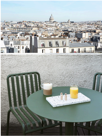
@ Christophe Coenen