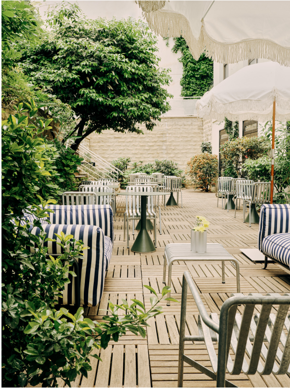
← @ Christophe Coenen