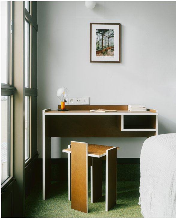
@ Christophe Coenen