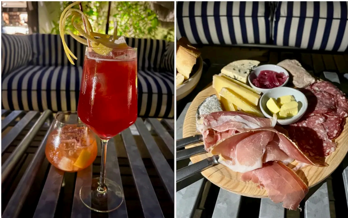
Cocktails et tapas à l'Hôtel Rosalie, Paris 13e

produits locaux en circuit court . La carte fait la part belle au végétal avec du chou-fleur gratiné au parmesan, paprika et sauce barbecue maison, du guacamole de brocolis , oignons rouges, coriandre et chips de pita, ou encore de la tapenade de tomates séchées , olives vertes et focaccia maison (notre coup de coeur) entre 9€ et 14€. On vous conseille également la planche mixte (à 25€) avec de la charcuterie de la Boucherie des Gobelins , des fromages de la Fromagerie Cazard ... et des aromates qui viennent directement des jardinières de l'hôtel ! Mention spéciale aussi aux cocktails originaux , concoctés par le chef barman qui réalise lui-même ses sirops avec les produits du potager .