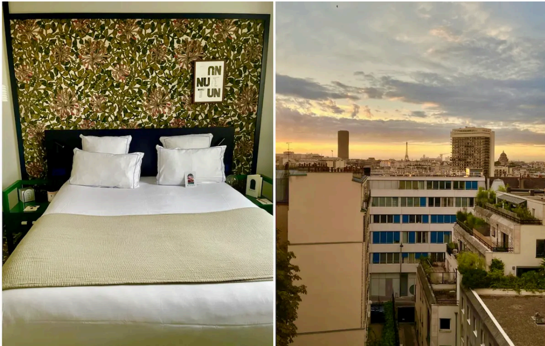
Chambres de l'Hôtel Rosalie, Paris 13e

été totalement charmés par la vue à couper le souffle dont bénéficient certaines chambres sur la Tour Eiffel , le Panthéon, le Sacré-Coeur et les toits de Paris si emblématiques !