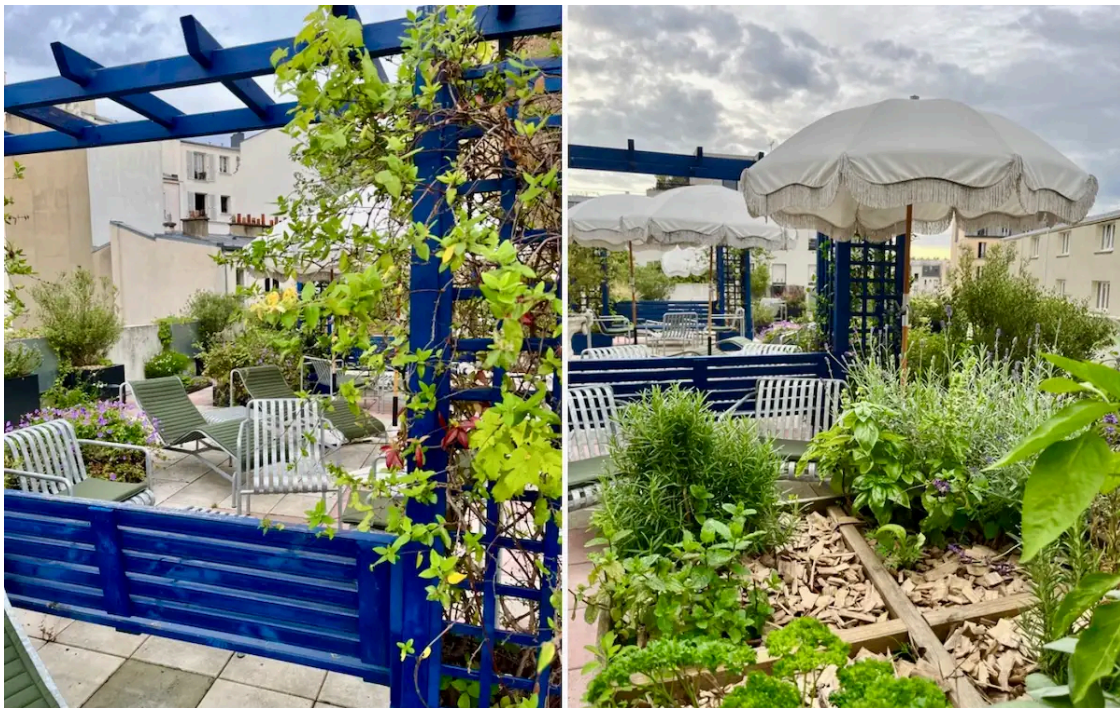
Jardins de l'Hôtel Rosalie, Paris 13 e

Impossible de l'imaginer de l'extérieur mais ici, la nature semble avoir repris ses droits. Une végétation luxuriante nous accueille dès l'arrivée, un jardin public dissimulé en sous-sol abrite le bar à cocktail et le restaurant de l'hôtel, une autre terrasse au rez-de-chaussée invite à la détente et dévoile une houblonnière de 6 mètres de haut qui servira à confectionner la bière Rosalie , tandis que le potager secret perché au 3 e étage et réservé à la clientèle nous dépaysage totalement avec ses hôtels à insectes, ses nichoirs à moineaux ... Et sa vieille 205 Junior rouge abandonnée envahie de lierre ! Au total, ce sont 400 m 2 d'espaces verts , entretenus sans pesticides, qui nous offrent une échappée inattendue loin de l'agitation urbaine, tout en étant en plein cœur de la ville.