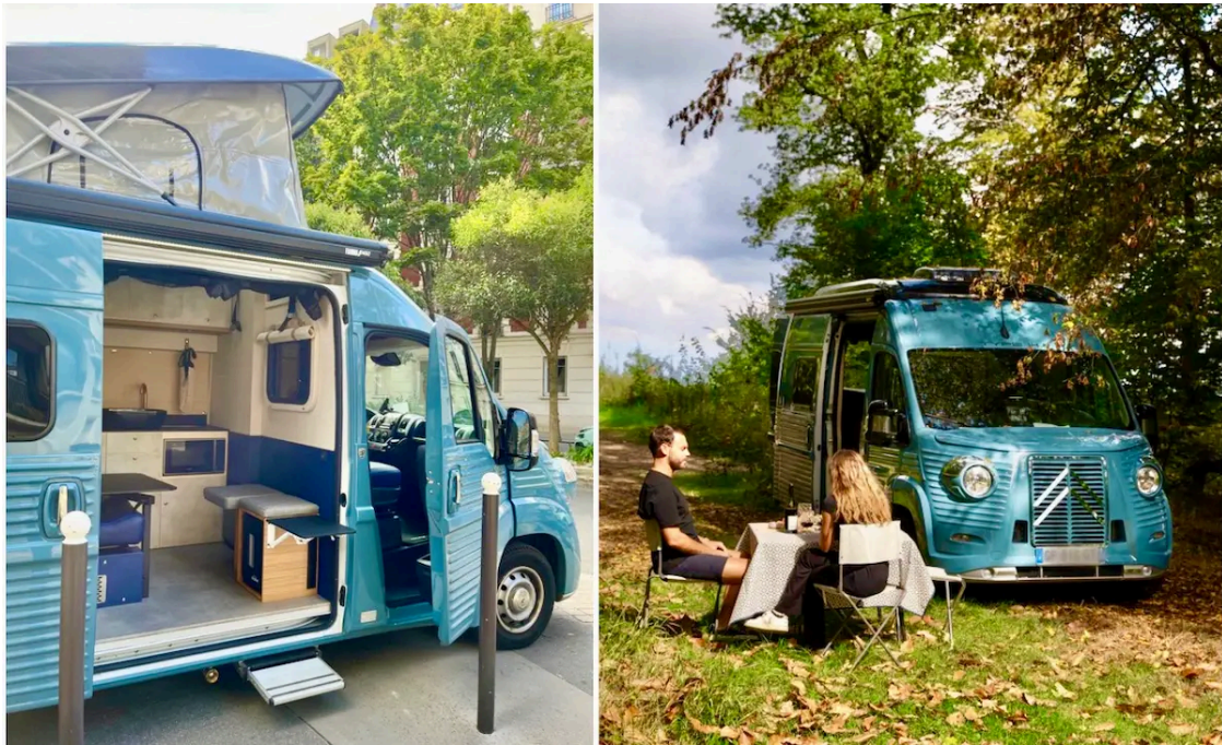
Van de l'Hôtel Rosalie, Paris 13e