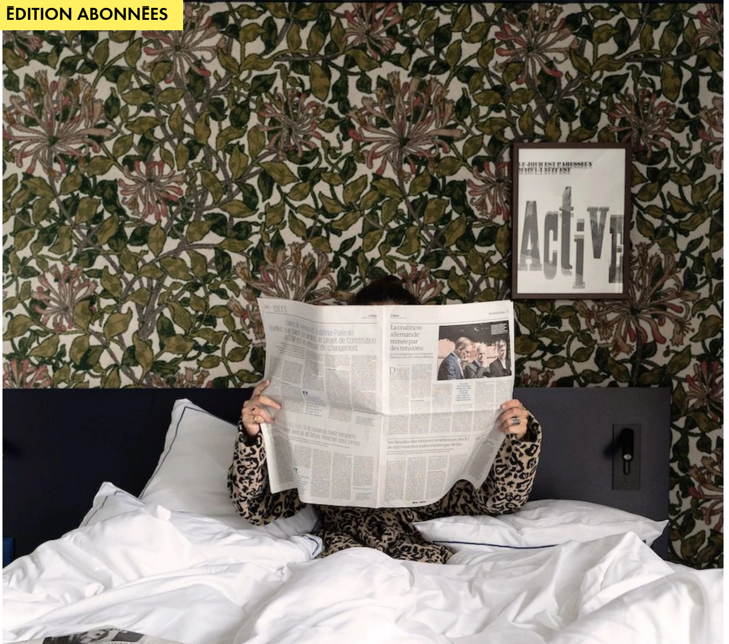
Hôtel Rosalie, Paris 13e